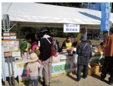
開催者：堺市商店連合会主催 情報元 URL : http://www.facebook.com/sakaiakindo

地元の商店をはじめ名古屋、鹿児島など全国からうまいものや、手作りの雑貨やアクセサリが大集合!! 紀の川市観光協会からは採れたての柿やあんぼ柿、金山寺みそ、桃のパウンドケーキなどたくさんの商品を販売!お天気にも恵まれ大盛況でした。堺市のキャラクターの一つ「ムーヤン」は、ごみ減量大好きでポリバケツを頭にかぶり緑はゴミ袋をイメージしているそうです。(じゅんちゃん)