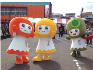
開催者：紀の川市産業まつり実行委員会 紀の川市食育推進会議

恒例の農産物品評会&販売や「仮面ライダードライブショー」「アキナ お笑いライブ」「おもしろ早食い競争」等、多彩なイベントの他、おいしく体験・学習できるジャンボ巻寿司作りや、もちまきもあって子ども連れの家族で大盛況!! 観光協会のブースではパンフレットやマップ等でPR活動をしていました。マスコットキャラクターの「かきぶる、さくぶる、きうぶる」がお披露目され、子ども達に大人気でした!(ももちゃん)