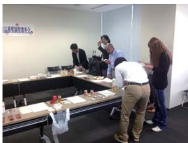
開催者：紀の川市観光協会

5業者13商品の審査会が、和やかかつ厳粛な空気の中で開催されました。審査員の方々はとても真剣な面持ちで一品、一品、何度も試食していました。中でもお菓子類の味がよく出来ていると口々に話し、その他ハスもち、こんにゃく、はちみつなど、色々な製法を活かして試行錯誤している様子が見られました。審査委員長は、「この試みにより、商品を販売するだけが目的ではなく、より沢山の人の繋がりになれば。」と話していました。(りきさん)