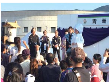
開催者：青洲まつり実行委員会

10月26日に青洲まつりが開催されました。出店や催し物などがたくさんあり、とても楽しかったです。中でもやはり最後の時代行列は圧巻でした。今年はお本当のご夫婦が青洲と加恵役をして下さったためか余計にご夫婦とも笑って行列されていたのが見ていてうれしく思いました。この夫婦役は公募していますので、是非!参加してくださればと思います。(編集長)