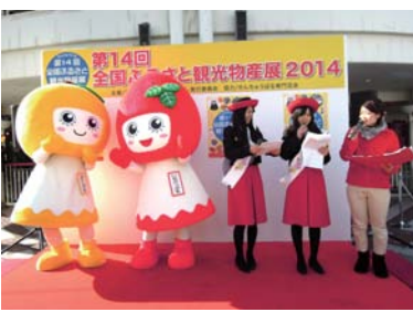
開催者：全国ふるさと観光物産展実行委員会

豊中市新千里東町1-3-149 ■12月12日(金)~14日(日) 10:00~18:00 せんちゅうパル南広場