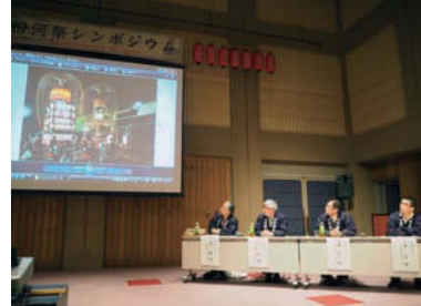
主催：紀の川市文化遺産活用・観光振興・地域活性化事業実行委員会 共催：粉河祭保存会

和歌山県無形民俗文化財指定 50周年を迎えた「粉河祭」について、参加者自らが学び、考え、話し合うことで、その歴史と伝統の深さを再認識してもらい、保存・継承に対する意識の高揚を目的にシンポジウムが開催されました。 当日は、210名の参加者で会場が埋めつくされ、「粉河祭の文化財的価値について」の講話や「どなえすりゃ!?! 粉河祭」を題材にしたパネルディスカッションに、観客は興味深く耳を傾けていました。(事務局)