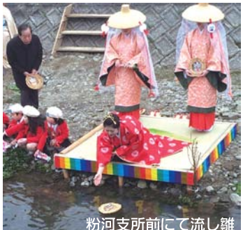
粉河支所前にて流し雛

次回のワークショップは、5月10日(日)の14時から、場所は今までと同じ紀の川市役所本庁7階ラウンジです。