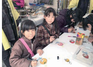
主催：旅まつり名古屋実行委員会

「旅と宿と人のふれあい」をコンセプトに国内外の旅情報・物産が大集合したイベントに参加しました。国内だけでなく海外からも出展していました。皆それぞれ趣向を凝らした観光PRをしていました。私達紀の川市のブースでは「フルーツ王国!! 紀の川市」としてデコポンやいちご等の農産物をはじめ様々な加工品の販売や、体験コーナーでは桃ジャム作りやぶるぶる娘を型どったプラ板等の体験には予想以上の反響に私達もビックリ!! (あけさん)