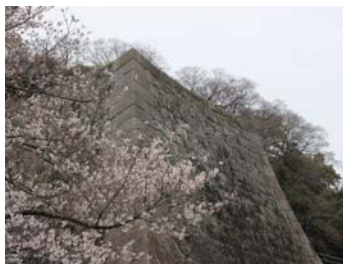
高虎が築いた和歌山城の高石垣

和歌山城は「紀州御三家」のイメージが強いですが、今、ブームの戦国時代のファンにとっては藤堂高虎の築いたお城や石垣が大人気です。地元の人でも知る人が少ない「猿岡城」ですが、ぜひ一度訪ねて下さい。来年のNHK大河ドラマ「真田丸」は、九度山に蟄居させられた真田幸村を描いたドラマです。この幸村が和歌山城まで馬で行き、暮を楽しんだという説があります。このように地元の歴史を少し知っておくだけでも、ドラマがより一層楽しめるのではないのでしょうか。