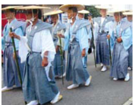
紀の川市長も白馬に乗って♪