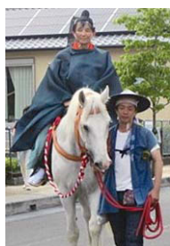
和歌山県知事もご参加いただきました↑