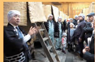
九重雑賀様でお酒とお酢の蔵見学。食酢の製造見学は全国でも珍しいものです。

三月五日から四月九日の期間中、市域全体で開催された催しの一部を写真でお楽しみください。ね。