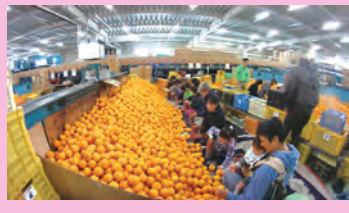
JA紀の里農産物流通センターを特別に見学、たくさんのハッサクは圧巻です。