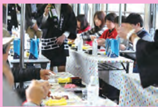
JR和歌山線臨時列車「ぶるぶるトレイン」はJR西日本と力寿し様、(株)九重雑賀様とのコラボにより実施されました。