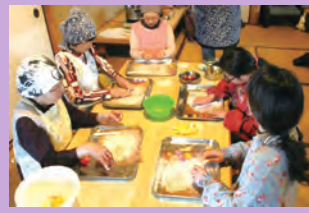
フルーツを包んだ生八つ橋と「ぶるぶる娘」のおまんじゅう作り体験です。