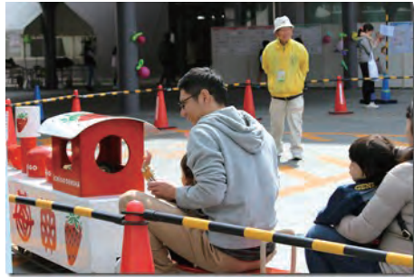
和歌山電鐵さんのミニいちごトレイン