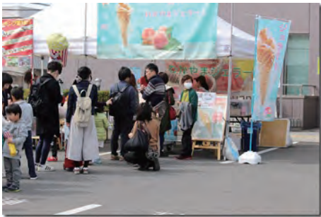
藤桃庵さんのフルーツジェラート