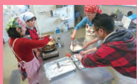
なかなか手に取ることもない桃のジャム作りは、桃の産地ならではの体験です。