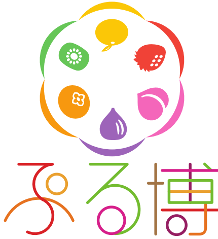
紀の川フルーツ体験!ぷるぷる博覧会

この日をスタートとし四月九日までの約一か月間、紀の川市全体を会場とする体験型博覧会が開催されました。オープニングには多方面から大勢のお客様でにぎわい、フルーツにちなんだ体験をしたり、食べたりと楽しいひと時を過ごしていました。紀の川市の市民や紀の川市に興味のある方々が企画し、仕掛け人となり、市の職員の方々のお力添えの中、体験型博覧会「ぷる博」が開催されました。知恵を出し色んな業種の人達が集まり、知恵を出し合いスタートから約二年半でここまで来りました。大勢の力という計り知れない物が存在しているのです！！