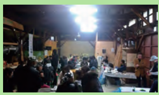
大人向けの夜の催し「フルブラで乾杯」を企画しました。音楽って良いですね、こんなに仲間が集まる！