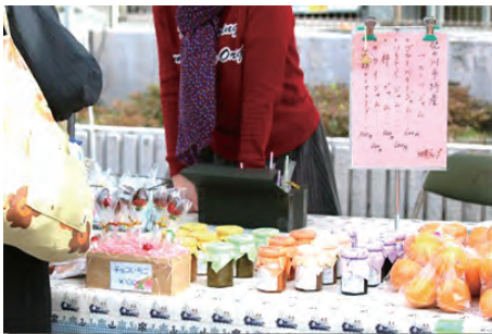
紀の川市ならではのフルーツジャム