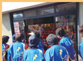
粉河高校生の案内でとんまか雛通りから粉河寺までを雛さんぽ