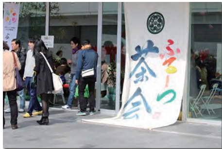
人気のふるうつ茶会