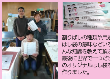
割りばしの種類や用途、はし袋の意味などいろいろな知識を教えてください、最後に世界で一つだけのオリジナルはし袋を作りました。