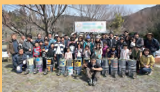
ロケットストーブ作り体験 手作りしたロケットストーブで季節のフルーツが入ったピザ焼き体験。