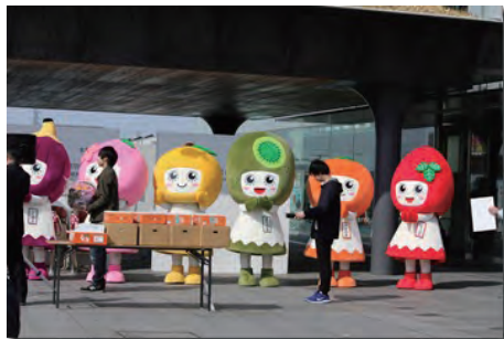
ぷるぷる娘も大ハッスル〜