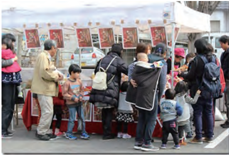
フルリアルさんのフルーツぱん直売