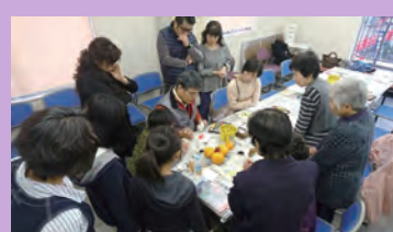
絵手紙作家さんに教わり紀の川の旬のフルーツを絵手紙に仕上げます。