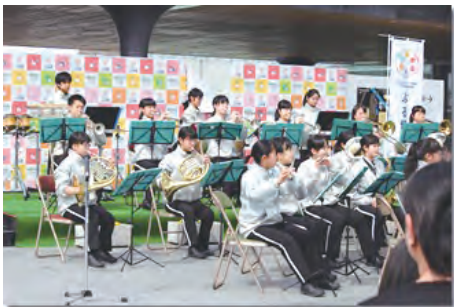
打田中学吹奏学部さんによる演奏

この日をスタートとし四月九日までの約一か月間、紀の川市全体を会場とする体験型博覧会が開催されました。オープニングには多方面から大勢のお客様でにぎわい、フルーツにちなんだ体験をしたり、食べたりと楽しいひと時を過ごしていました。紀の川市の市民や紀の川市に興味のある方々が企画し、仕掛け人となり、市の職員の方々のお力添えの中、体験型博覧会「ぷる博」が開催されました。知恵を出し色んな業種の人達が集まり、知恵を出し合いスタートから約二年半でここまで来りました。大勢の力という計り知れない物が存在しているのです！！