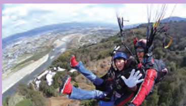
ぶる博を機に地元の人もパラグライダーに挑戦