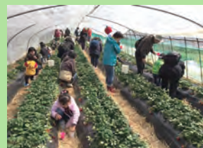
「いちご電車」に乗り、いちご狩りにいちご大福づくりといちごづくしの体験です。