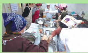
こんなにやくは色々食べたけど、フルーツのこんにやくはここだけ。こんにやくの不思議な感触を楽しみながら作りました。