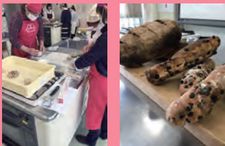
フルール様の地元のフルーツを使ったパン教室